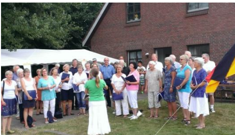
Der Chor „Rüm Hart“

Di traad Augustmuun haa wi "üüs skap" feiret. Jüst hü uun a leestst juaren haa föl minsken holpen: plaanin, kuuken baag, ferkuupin, uun` t köögem, bütjen mä iidj an drank, musik maagin... At weder hää uk mäspelet an so san wi rocht soonkbor för aal jau halep an di fiinen dai.